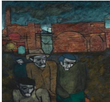
Resim -8 Gece Vardiyasının Sonu, 1972, Tuval Üz. Yağlıboya, 102x75cm

Eser Yorumu: Dışavurumcu bir teknikte çalışılmış olan bu eserde Muhsin Kut, bir iletişimden uzak kendi dünyalarına yönelmiş bu figürlerle, bir arada olsalar bile birbirlerine yabancılaşan insan ilişkilerine göndermeler yapmaktadır. Rahatsızlık verici gücüyle kırmızının adeta çılgınlığı resimde sanatçının iç dünyasındaki karmaşıklığın sesi olarak yankılanmaktadır. Sanatçının kendisini tasvir ettiği erkek figürünün ayaklarının bastığı zeminin yeşili ile kaybettiği ve özlem duyduğu hayatındaki huzurlu anlarına karo taşlarla oluşturulmuş zeminle de küçük odacıkları andıran ve sanatçının yaşamından geçen huzurlu sınırlı anlar vurgulanmak istenmiştir.(Resim7)