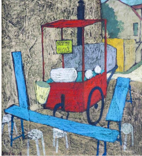
Resim-9 Köfte, Piyaz, Tuval Üzeri Yağlıboya 19x19cm

Eser Yorumu: Sanatçı, Gece Vardiyasının Sonu adını verdiği bu çalışmasında toplumsal konular içinde işçi sorunlarına değinmiştir. Gecenin kör vakitlerinde fabrikadan çıkan dört işçi figürünü yüz ve bedenlerindeki yorgunluk hissini sanatçı eserinde izleyicilerine hissettirmektedir. Fabrika bacasından gökyüzüne doğru gri dumanın kasvetli yükselişi resmin bütünündeki ağır havayı tamamlar niteliktedir. Bu çalışmasında işçi sınıfının ağır çalışma şartlarına değinmek isteyen Muhsin Kut, resmini dışavurumcu tarzda oluştururken bu işçilerin duruşlarından çaresiz, umutsuz ve tedirginliklere de tercüman olmak istemiştir. (Resim-8)