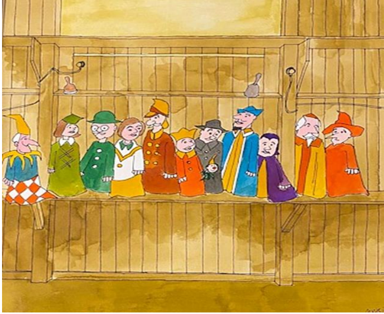
Resim-5 "Kuklalar", 2009, Karton Üzeri Karışık Teknik, 45x38 cm.

Eser Analizi: Muhsin Kut, bu çalışmasında kullandığı renkli kuklaları ile karşımıza çıkmaktadır. Kuklaların kırmızı, mavi, yeşil, siyah, sarı renkli ve farklı tarzda kıyafetleri, figürlerin hareketsiz duruşlarına rağmen resme canlılık kazandırılmıştır. Ahşap basamaklı bir mekânda ilk katında bulunan kuklaların portrelerinde detaylardan kaçınıldığını görülmektedir. Sarı ve kahverengi değerleri ile oluşturulmuş bu mekânda kadın, erkek, genç, yaşlı figürler ayakta farklı yönlere doğru bakmaktadır. Kuklaların yüzlerinde genel olarak durgun bir ifade yer almaktadır.