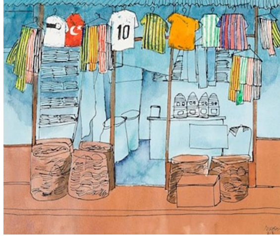
Resim-10 Mahmut Paşa, 2008, Kâğıt Üzeri Karışık Teknik 24 x 30cm

Arabanın etrafındaki masaların mavi gücü İstanbul'un eskide kalan mavisidir. Beyaz ancak kirli bir görüntüye sahip olan taburelerde insan olmayışı, adeta bizleri eski İstanbul'un geçmişte kalan anlarını yaşamak üzere davet eder gibidir. (Resim-9)