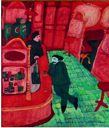
Resim-7 Cafe Rotonde, Paris, 1975, TÜYB, 90x63cm

Eser Analizi: Canlı bir kırmızı ile yeşil rengin güçlü kontrastını gördüğümüz bu eserde biri kadın diğeri erkek, farklı yönlere bakan iki ayakta figür fark edilmektedir. Bir kafe mekânının içerisinde bulunan bu figürler dışında başka kimse yer almamaktadır. Sanatçı, perspektif kurallarına aykırı bir mekân tasarımı ile çok renklilikten kaçınan yaklaşımıyla daha çok yeşil ve kırmızı renk değerlerini kullanmıştır., Kadın figürünün olduğu bar kısmında da yine yeşil ve kırmızı renklerde bardak ya da şişelerde konulmuştur. Mekânın zemininin kare taşlarla döşenmiş olduğu, resimde ağır basan kırmızıyla dengelenmektedir.