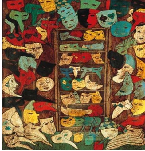
Resim-6 Maskeler Serisi, Tuval Üzeri Yağlıboya, 1989, 107x77 cm

Eser Analizi: Resim 6 da toprak renginde oluşturulmuş oda, karşımızda sekiz raflı bir dolap ve dolabın önünde yeşil renkte bir masa görülmektedir. Odanın her tarafı renkli maskelerle doldurulmuştur. Raflı dolapta sıralı fark edilen renkli maskeler, oda içerisindeki diğer maskelerin dağınık görüntüsünü dengelemektedir. Masa üzerinde daha çok açık renkte maskeler yer almıştır. Masa ortasında ise sarı, turkuaz ve kırmızı dört bardak ve içlerinde turkuaz renkte pipetler ile maskelerde genel olarak insan portrelerine yer verilmiştir. Bunun yanında ay ve hayvan biçimlerine de rastlanılmaktadır.