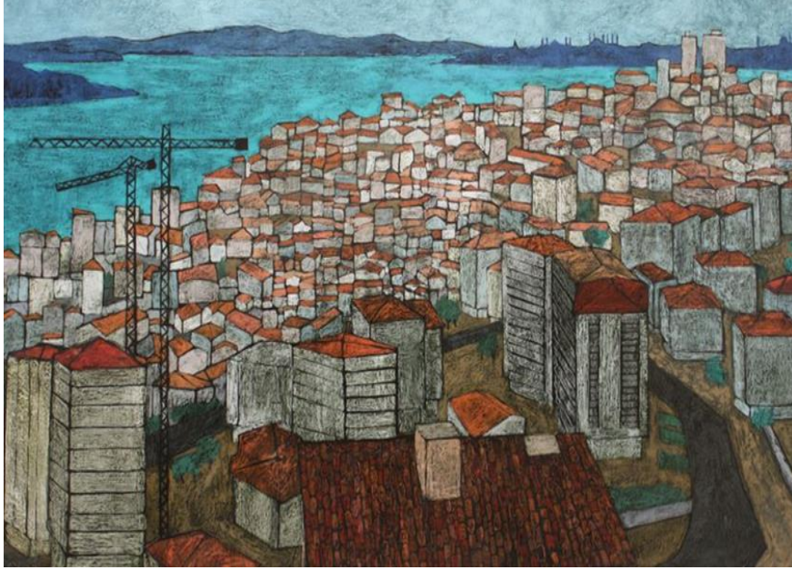
Resim-4 1959'dan 2019'a 60 Yıllın İzleri Serisinden

Eser Analizi: Büyük-küçük binalar, kalabalık ve sıkışık bir şekilde resmin çok büyük bir alanını kaplamaktadır. Yukarıdan bakıldığında binaların çatıları turuncu renge, yan yüzeyleri ise daha çok beyaz ve gri renklerde boyanmıştır. Resmin sol kısmında iki elektrik direğine benzeyen uzun direkler fark edilmektedir. Resimde mavi deniz, evler ile lacivert dağların arasında yer almaktadır.